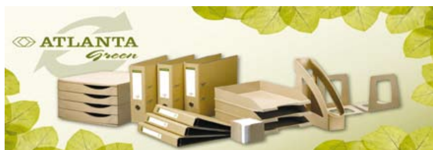
Atlanta Green, une gamme esthétique et durable composée de produits 100 % recyclables.