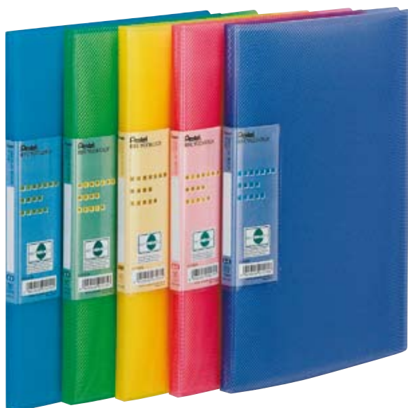
La gamme Recycology plaît aussi par ses couleurs et son look. (Pentel)