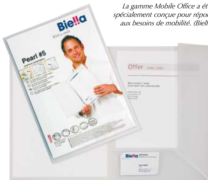
La gamme Mobile Office a été spécialement conçue pour répondre aux besoins de mobilité.