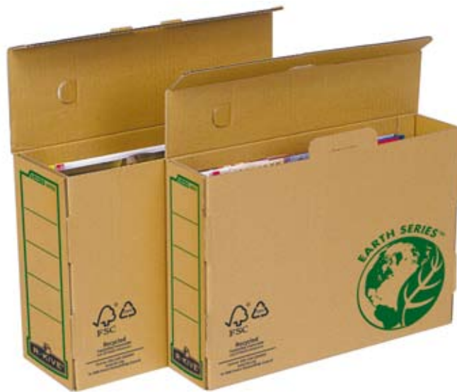
Une gamme en kraft 100 % recyclé et certifié FSC qui compte 13 produits à assemblage manuel. (Fellowes)

dans les entreprises sera un ordinateur et une imprimante avec autour un système de classement léger. Soit des pochettes, des chemises, des boîtes