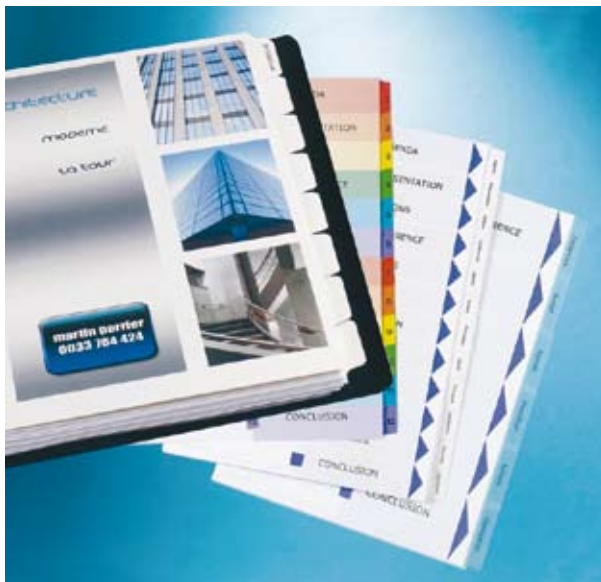
Ready Index, des intercalaires imprimables avec quatre sous-répertoires alphabétiques derrière chaque touche numérique de couleur. (Avery)

En privilégiant le classement de proximité et exposé, dans la mesure où les produits ne sont plus rangés dans les armoires, mais au contraire placés sur le bureau, les besoins des entreprises rejoignent de plus en plus ceux de la