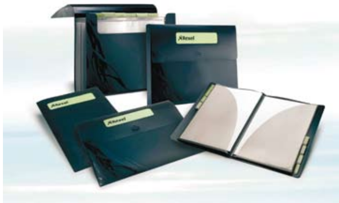
Fabriquée à partir de matériaux 100 % recyclés et recyclables, la gamme Eco Desk a reçu la certification cradle to cradle.