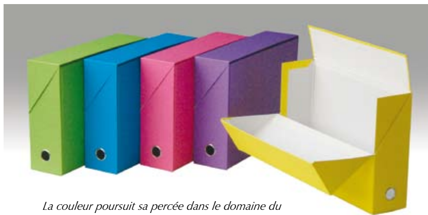
La couleur poursuit sa percée dans le domaine du classement aidée en cela par la nouvelle visibilité donnée aux produits de classement sur les bureaux.