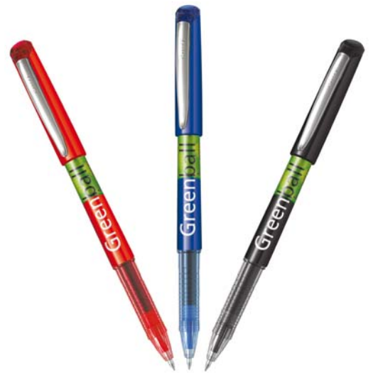
La gamme Begreen s'enrichit de nouveaux instruments. (Pilot)

connues puisqu'il bénéficie de la certification européenne EMAS. Dans le domaine de l'écriture, rechargeabilité et éco-responsabilité sont d'ailleurs des notions étroitement liées. « La première version du Slider offrait déjà une durée d'utilisation beaucoup plus longue que celle d'un stylo gel classique. Avec l'arrivée de la version rechargeable, la boucle écologique est bouclée », ajoute Serge Gratzl, précisant que la qualité des produits et la performance écologique constituent les deux priorités du fabricant.