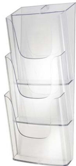
Une gamme de supports en acrylique transparent. (Sigel)

de CEP, c'est à la joaillerie qu'elle emprunte son univers avec ses coloris saphir et améthyste. Design épuré, couleurs denses et profondes, c'est