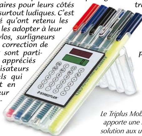
Le Triplus Mobile Office apporte une nouvelle solution aux utilisateurs itinérants. (Staedtler)

Triplus Mobile Office de Staedtler apporte une nouvelle solution aux utilisateurs itinérants en réunissant trois feutres, un stylo bille, un porte-mines et un surligneur dans un étui-chevalet qui à la fois protège les instruments lors de leur transport et facilite leur utilisation. Le fabricant a même ajouté une calculatrice sur l'étui ce qui lui permet de qualifier son produit de «véritable couteau suisse de l'écriture» !