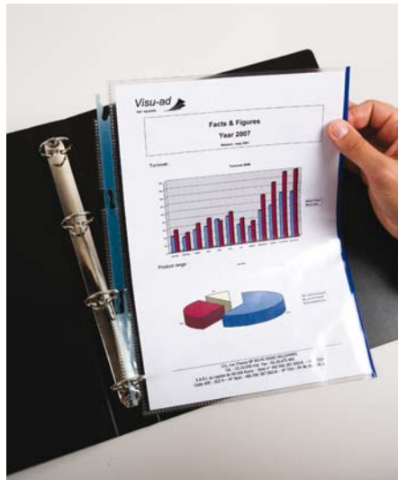
FastBinder, une solution de reliure brevetée permet d'accrocher et de décrocher des pochettes perforées de toutes tailles sans ouvrir les anneaux.

et dans plusieurs pays européens de façon à obtenir des solutions globales. A travers ces «focus groups», nous identifions les différents problèmes qu'ils rencontrent en termes d'ergonomie ou d'outils de classement afin d'y remédier», poursuit-il.