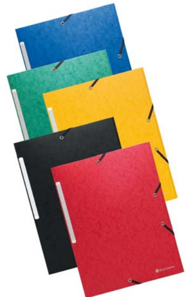
Scotten, une carte lustrée et gaufrée en fibres neuves ce qui lui donne un aspect de relief au toucher. (Exacompta)

La carte lustrée est également le matériau de base de la nouvelle gamme