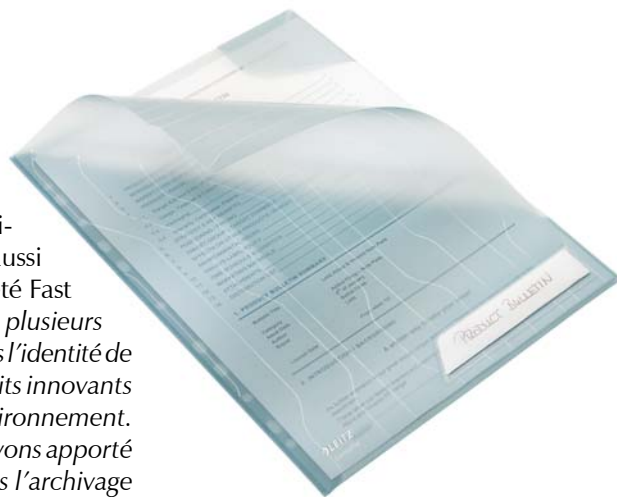
Les pochettes CombiFile sont polyvalentes à la fois perforées, mais qui peuvent aussi être transportées et utilisées comme des pochettes coin. (Esselte)

D'autres nouveautés écologiques sont annoncées pour le début de l'année prochaine. Exacompta fait du respect de l'environnement un de ses axes principaux de travail qui va se concrétiser par plusieurs innovations en 2008. «Dans cette démarche, no-