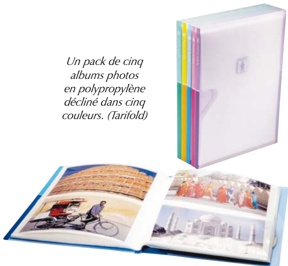
Un pack de cinq albums photos en polypropylène décliné dans cinq couleurs. (Tarifold)

Folder, une chemise avec des rabats solidaires, et non pas agrafés ou collés, ce qui assure un parfait maintien des dossiers et augmente la capacité de stockage», explique-t-elle. Autre innovation chez ce fabricant, le concept Krea Cover, une gamme complète d'articles de classement personnalisables couvrant tous les besoins d'organisation, de protection et de présentation. Cette gamme a été complétée cette année d'un classeur personnalisable sur la face, la tranche et le dos avec un seul document A4 standard que l'utilisateur peut réaliser sur son imprimante à l'aide d'un fichier de paramétrage qui est disponible sur le site du fabricant.