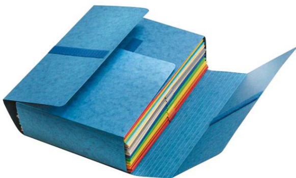
Equipée de quatre rabats, la chemise Jumbo allie des fonctionnalités de la chemise à élastique et de la chemise extensible et s'adapte à l'épaisseur des documents grâce au rainurage des rabats.