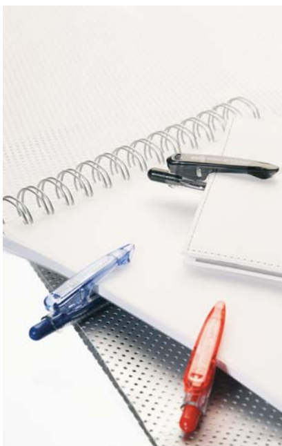
Un stylo bille, le Clifter auto-rétractable équipé d'un clip extensible sécurisé également décliné en version porte-mines. (Uniball)

A côté du confort d'écriture, le développement de l'offre «verte» est l'autre axe majeur de l'innovation. Ainsi, en début d'année, Pilot a enrichi sa gamme Begreen de deux nouveaux instruments d'écriture, le Greenball 7 et le Green Tecpoint 5, et d'un correcteur à bande, le Whiteline RT. Conformément au cahier des charges de la gamme, ces trois produits sont rechargeables et fabriqués à partir de matières recyclées, y compris le corps des cartouches du Greenball et du Green Tecpoint. Autre nouveauté «verte», le Power Tank Green Net d'Uniball, une nouvelle version du stylo bille qui est fabriquée pour 60 % à partir de matériaux recyclés. Aujourd'hui c'est au tour de Pentel de se positionner sur ce marché avec l'introduction d'une toute nouvelle gamme sous l'ombrelle Recycology lancée pour cette rentrée. Cette gamme est composée d'une vingtaine de références, toute rechargeable et produite avec des matériaux recyclés, dans laquelle toutes les catégories de produits sont représentées, rollers,