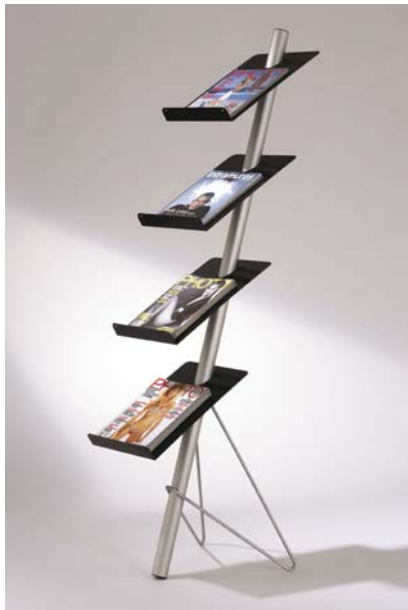
Mufrid, un présentoir alliant un design original et la facilité de l'assemblage et du démontage. (Planorga)

Folder, une chemise avec des rabats solidaires, et non pas agrafés ou collés, ce qui assure un parfait maintien des dossiers et augmente la capacité de stockage», explique-t-elle. Autre innovation chez ce fabricant, le concept Krea Cover, une gamme complète d'articles de classement personnalisables couvrant tous les besoins d'organisation, de protection et de présentation. Cette gamme a été complétée cette année d'un classeur personnalisable sur la face, la tranche et le dos avec un seul document A4 standard que l'utilisateur peut réaliser sur son imprimante à l'aide d'un fichier de paramétrage qui est disponible sur le site du fabricant.