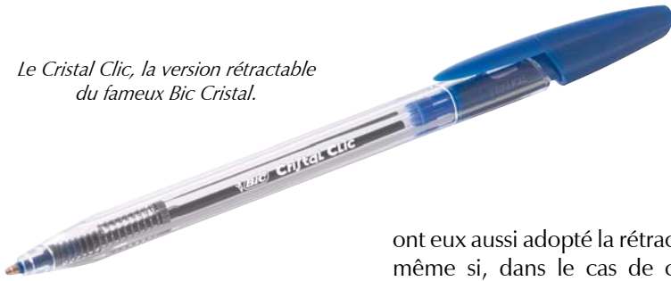
Le Cristal Clic, la version rétractable du fameux Bic Cristal.

Cette petite révolution qu'est le Cristal Clic s'inscrit dans une tendance qui s'affirme d'année en année : la préférence donnée aux instruments rétractables. C'est maintenant une demande récurrente de la part de la clientèle des adultes et l'une des caractéristiques les plus évidentes différenciant aujourd'hui le marché professionnel du marché scolaire. Les nouveautés sont également nombreuses sur le segment de la rétractabilité. Et d'abord le dernier des stylos bille lancé par Uniball, le Clifter auto-rétractable équipé d'un clip extensible sécurisé et également décliné en version porte-mines. La rétractabilité s'impose comme une fonctionnalité appréciée, voire incontournable au bureau, et s'étend à de nouveaux instruments. Aujourd'hui les surligneurs sont concernés ainsi que les marqueurs dont les versions rétractables sont de plus en plus nombreuses. La dernière en date est annoncée par Pentel pour le début de l'année 2008 avec la sortie d'une version affinée de son gros marqueur rétractable. Les produits de correction