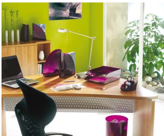
La gamme Carat emprunte son univers à la joaillerie.