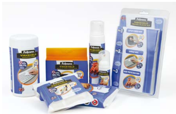
La gamme Virashield d'aseptisation du poste de travail anti-bactéries et antiviruses. (Fellowes)

L'autre est le Stérifilm de Tarifold, un film adhésif antimicrobien pour couvrir les livres, les magazines, ou les cahiers comme les poignées de portes, les interrupteurs ou les boutons d'ascenseurs. Son principe actif est un produit 100 % naturel, développé par la société Agion qui fabrique un composant anti-bactérien à base d'argent. Ce sont des ions d'argent intégrés à la matière qui, de par leurs propriétés naturelles anti-bactériennes, détruisent instantanément les bactéries déposées permettant ainsi de lutter contre la prolifération bactérienne. Le Stérifilm est proposé en rouleaux et en sachets de formats A4 et A5.